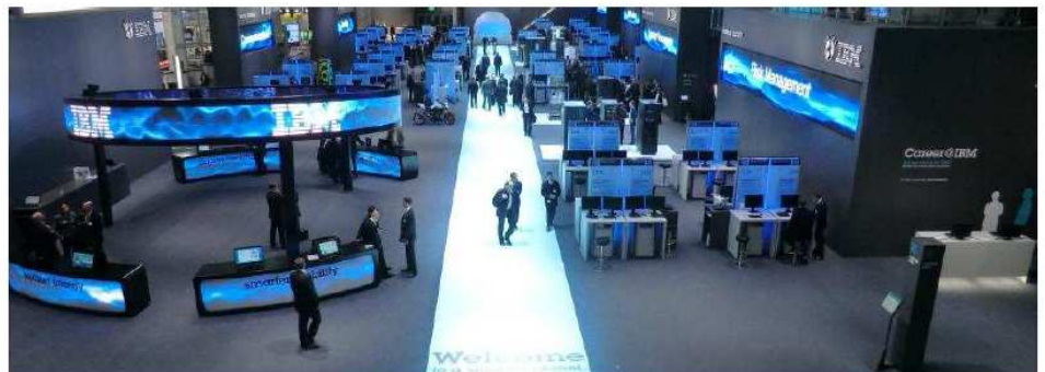
Die Welt der Tools- und Informationstechnologien für Menschen und Unternehmen