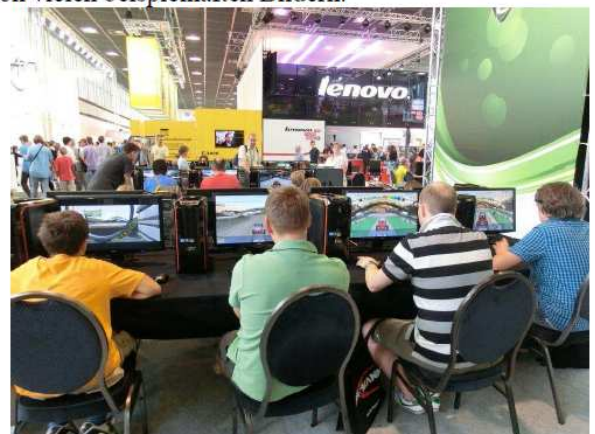
Die Mediengesellschaft 2020

Für unsere Zukunft stehen drei von vielen beispielhaften Bildern: