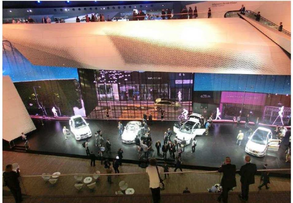
Die Welt der mediengestützten Daten- und Bildkommunikation